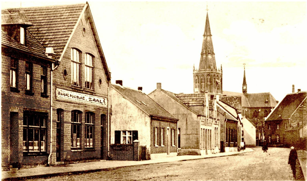
Posthuisstraat — Tegelen

De verschijningsvorm van de Harmoniezaal is karakteristiek voor het centrum van het dorp Tegelen. De gevel is opgebouwd conform de plaatselijke tradities in baksteen met bogen, rollagen en muizentanden. Verder zijn gebruikt houten kozijnen en met keramische pannen afgedekte samengestelde zadeldaken met houten bakgoten. Ook bezit de voorgevel een prominente naamsvermelding met gemetselde omlijsting. Sinds meer dan anderhalve eeuw bepaalt de Harmoniezaal mede de straatwand van een der oudste straten van de kern.